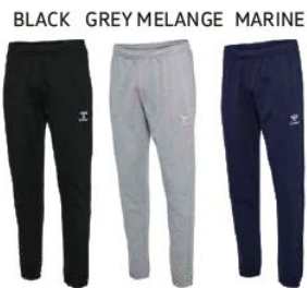
FARB-NR.: 2001 2006 7026

STÜCKPREIS UNISEX STÜCKPREIS JUNIOR 116-164 € 26,98 € 23,98