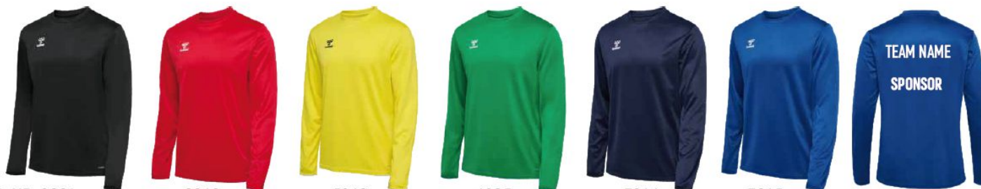
FARB-NR.:2001 3062 5269 6235 7046 7045

STÜCKPREIS UNISEX STÜCKPREIS JUNIOR 116-164 € 17,97 € 16,77