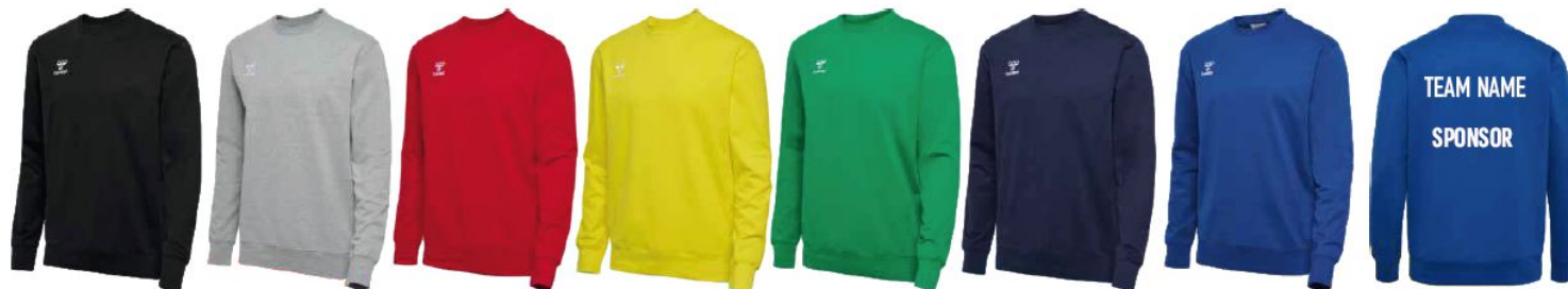
FARB-NR.: 2001 2006 3062 5269 6235 7026 7045

STÜCKPREIS UNISEX STÜCKPREIS JUNIOR 116-164 € 26,97 € 23,98