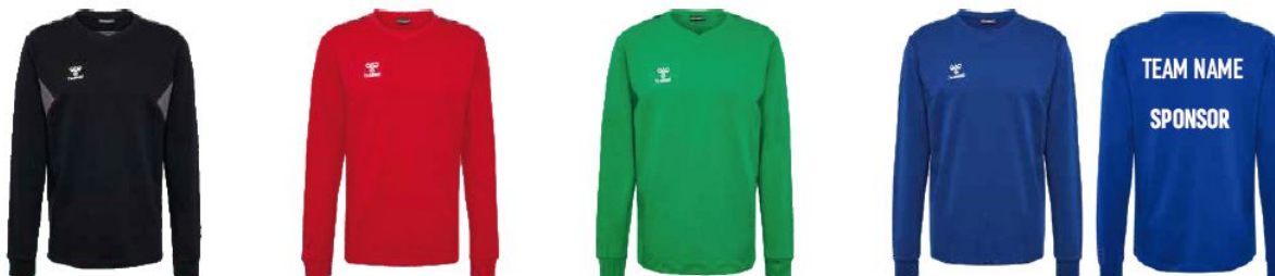
FARB-NR.: 2001 3062 6235 7045